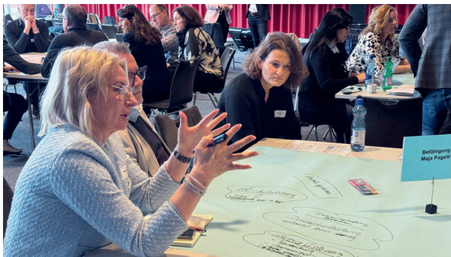
Nel terzo incontro del team strategico sono state raccolte idee per una consulenza più orientata alle esigenze delle persone in cerca di impiego.

gli utenti possono inoltre personalizzare le analisi in base ai propri interessi. In questo modo i decisori dispongono di uno strumento che soddisfa diverse esigenze di reporting. Inoltre la dashboard permette agli utenti di individuare esempi di buone pratiche e di trovare ispirazione per ulteriori progetti e misure. Uno spazio di scambio sul tema lo offrono gli incontri del team strategico, che si tengono tre o quattro volte l'anno e hanno l'obiettivo di discutere e coordinare l'attuazione della strategia.