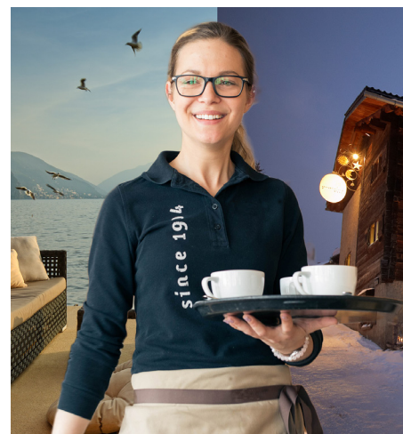
Saisonniers: au lac en été, dans la neige en hiver – transition aisée pour les régions de vacances

Depuis l'été 2018, la plateforme www.jobs2share.ch aide les demandeurs d'emploi à trouver des emplois complémentaires pour l'été et l'hiver et à proposer un paquet d'une année. Les entreprises publient leurs postes sur ce site et les saisonniers peuvent ainsi chercher un poste complémentaire à celui qu'ils ont déjà, ou en trouver un nouveau.