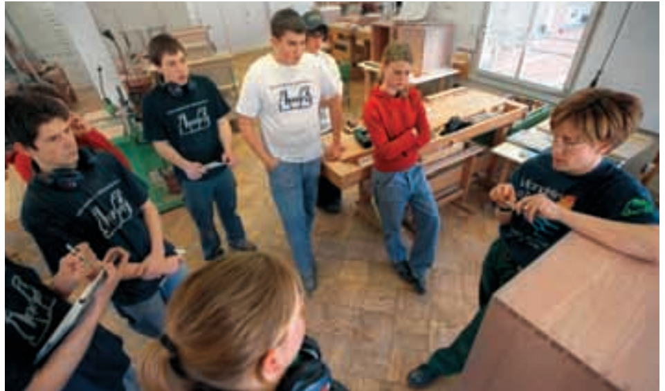
Die seit 1996 angebotenen Motivationssemester sind spezielle Beschäftigungsprogramme, welche Jugendliche bei der beruflichen Orientierung unterstützen. In Form von sozialen Unternehmungen ermöglichen sie den Jugendlichen individuelle Betreuung, Ausbildung und praktische Arbeit.

In einer Arbeitsgesellschaft wie der Schweiz ist Jugendarbeitslosigkeit ein schwer wiegendes Problem, hängen doch von der Berufsausbildung und -arbeit wichtige Faktoren wie Qualifikation, Belohnung und sozialer Einfluss ab. Es bestehen daher verschiedene Massnahmen zur Eingliederung Jugendlicher in die Arbeitswelt. Eine solche Massnahme der Arbeitslosenversicherung ist das Motivationssemester (semo). Dieses hat zum Ziel, jugendliche Arbeitslose zur Eingliederung in den Arbeitsmarkt, falls möglich über eine Ausbildung, zu motivieren. Die Erfolgsquote lag in den Jahren 1999–2002 bei 60%.